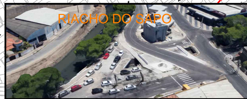
RIACHO DO SAÇO